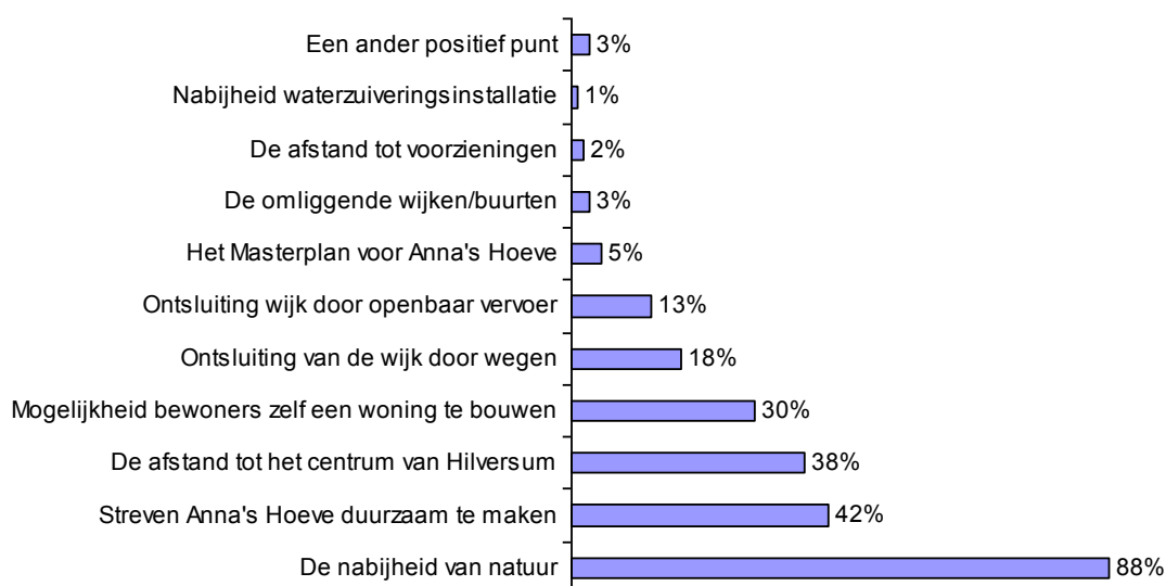
Positieve punten van Anna's Hoeve als woonwijk

Onderstaande grafiek toont in hoeverre een aantal aspecten als positieve punten van de locatie Anna's Hoeve als woonwijk worden gezien door deze panelleden: